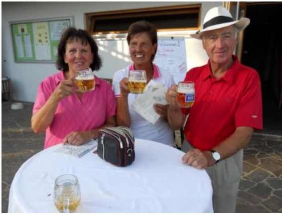
nach dem Spiel schmeckt das Bier (vom „Passailer Durstlöcher“ - Puntigamer Feuerwehrauto) auch besonders gut